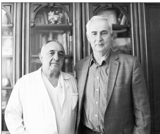
Легендар һәм фидаяр, милләт жанлы Ренат Акчури н белән аның эш кабинетында. Әле генә операция ясап чыккан чагы. Фоторәсем 2017 елда шагыйрь Наил Касыймов тарафыннан төшерелде. Мәскәү шәһәре.