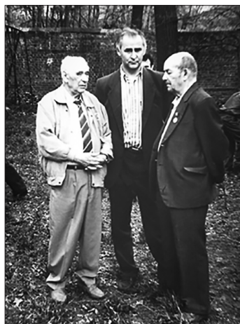
Татарстан Язучылар берлеге каршындагы бакчага Гомәр Бәширов һәм Әмирхан Еники, безне хәтерләтеп мәңге яшәсеннәр, дип, имәннәр утырткан. Ни кызганыч, ул имәннәр юк инде бүген... 1994 ел, сентябрьнең соңгы көннәре.