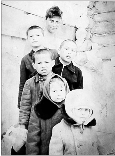
12 яшьләр чамасы, энекашлар һәм сеңел белән туган нигездә.

Һәр сатучыдан берәр прәник авыз итеп йөри-йөри, инде аяклар арыды, әмма тамак туймый икән һаман. Прәник сатучыларның очы-кырые юк, офыкка тикле тезелгәннәр.