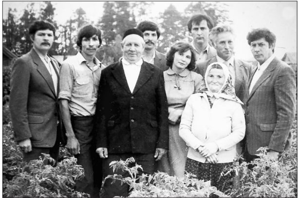
Якын туганнары белән.

– Юк, улым, тапмадым әлегә. Ат түгел, кеше узарлык түгел шул бу кар өстеннән, тирән салган.