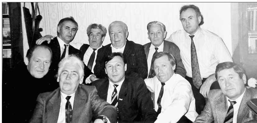
Беренче рәттә сулдан уңга: Рифкәт Исрафилов (режиссёр), Муса Гали, Равил Галимуллин (Башкортстанның Чишмә районы җитәкчесе), Ренат Харис, Рауль Мир-Хәйдәров; икенче рәттә: Ринат Мөхәммәдиев, Мостай Кәрим, Рәсүл Гамзатов, Гариф Ахунов, Хәйдәр Бигичев. 1994 ел.