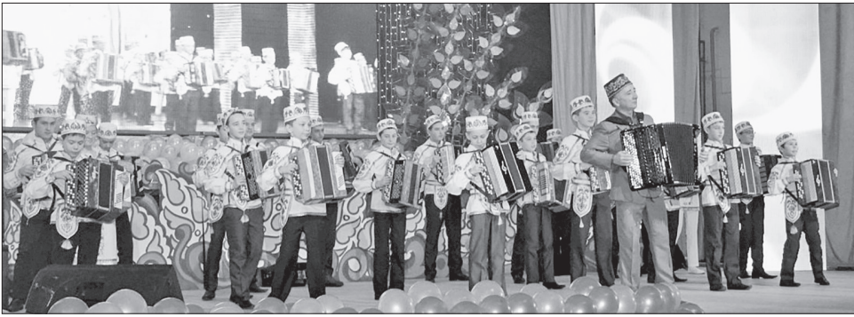
Инсаф үзенең шәкертләре белән

Жәмлә кирәкми. Бер, бары тик бер сүз – «Әфганстанда» дип хәбәр итүен житә, әнкән дә сиңа кушылып шул ук ялкыннарда яна... Эһә, янәшәдәге егетләрнең берсе хатка: «Мин Монголиядә», дип язып маташа – конверттагы кыр почтасы номерына карап, чит илдә икәнән барыбер чамалаячаклар... «Әһи авыру минем, Әфганда дисәм, шунда ук үлчәк», – мәктәп бусагасыннан гына атлап, чып-чын сугышка килеп эләккән егет-малайның иртә житлеккән фәлсәфәсе бу.