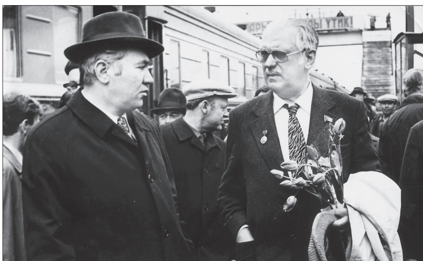
КПССның Татарстан өлкә комитетының беренче секретаре Фикһрәт Табиев, РСФСРның Язучылар идарәсе рәйесе, шагыйрь Сергей Михалков. 1979 ел.