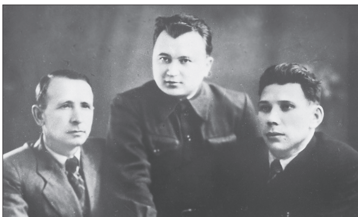
Ватан сугышында катнашкан шагыйрьләр. Сулдан уңга: Сибгат Хәким, Мәхмүт Хөсәен, Әнвәр Давыдов. Үткән гасырның 50нче еллары.