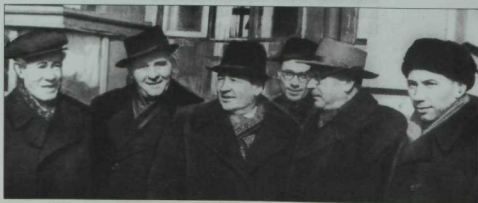
Ярты гасыр элек төшерелгән фоторәсем. Сулдан уңга: Хәсән Туфан, Габдрахман Минский, Нәкый Исәнбәт, Шәүкәт Галиев, Әмирхан Еники, Әнвәр Давыдов. 1965 ел.