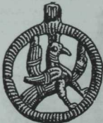
Борынғы Чаллы шәһәрәндә табылган Шәһәр гербы, талисман. XII гасыр.

Чаллы атамасының таралышына игътибар итик. Хәзерге чорда жәмһүриятебездә булган 20дән артык Чаллы атамасындагы авылларның 75-80 проценты Чулман буйларыннан 15-20 чакрым ераклыкта урнашкан. Чулманның үзенә үк биш Чаллы елгасы кушыла. Ә сонрак чорга карасак, Казан губернасы жирләрендә Чаллы атамасында барлығы 33 авыл санап үтелә. Ә Чел, Чул атамалары белән алар — 40ка, авыллардан тыш атамалар белән 60ка житә. Аларның урнашуы да борынғы Чулман буйларында. Мәсәлән, шул чордагы Лаешта — 11, элекке Алабуга, Малмыж, Минзәлә өязләрендә 7 Чаллы атамасындагы авыл була. Чалмат-Чаллыларның шул чордагы яшәү жирләре хәзерге Саба Күл, Тәмтеләрдән көнчыгыштарак, Чулман һәм Чулманга коя торган Чаллы елгалары тирәсендә урнашкан була.