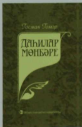
Гөсман Гомәр. ДАҺИЛАР МӨНБӘРЕ. Истәлек-хатирәләр. — Казан: Татар. кит. нәшр., 2015. — 303 б. Тиражы — 2000 данә.

Язучы Әнәс Хәсәновның бу романында яшъ замандашларыбызның жәмгыятъ тә тирән ижтимагый үзгәрешләр чорында – XX гасыр ахыры – XXI йөз башында – Россиядә янадан аякка басып килүче кыргый капитализм шартларында бәхеткә омтылулары, эзлөнү, хаталары, югалту-табышлары аша тормышта үз урыннарын табулары тасвирлана. Язучының геройлары – ихлас күнелдән яратып сурәтләнгән олылар, гомерләрендә күпне күргән хезмәтчәннәр, тормышны сөеп яшәүче милләттәшләребез.