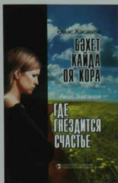
Әнәс Хәсәнов. БӘХЕТ КАЙДА ОЯ КОРА. Роман, хикәяләр. — Казан: Татар. кит. нәшр., 2015. — 319 б. Тиражы — 2000 данә.

Язучы Әнәс Хәсәновның бу романында яшъ замандашларыбызның жәмгыятъ тә тирән ижтимагый үзгәрешләр чорында – XX гасыр ахыры – XXI йөз башында – Россиядә янадан аякка басып килүче кыргый капитализм шартларында бәхеткә омтылулары, эзлөнү, хаталары, югалту-табышлары аша тормышта үз урыннарын табулары тасвирлана. Язучының геройлары – ихлас күнелдән яратып сурәтләнгән олылар, гомерләрендә күпне күргән хезмәтчәннәр, тормышны сөеп яшәүче милләттәшләребез.