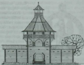
Борыңгы Чаллы шәһәрнең капкасы. Казу эшләре нәтиҗәләре буенча архитекторлар тарафыннан эшләнгән.

Челмат атамасына кинрәк тукталасым килә. Челматлар алар — Челман яисә Чулман кешеләре. Чулман — хәзерге Кама елгасынын шул чордагы аталышы. Чулман атамасы үзе дә төрле гасырларга караган елгызмалар һәм китапларда төрлечә языла. Мәмлүкләр чоры географы Әл-Омари (XIV гасыр) аны Чулыман, икенче бер габул авторы Ибн Халдун (1332-1406) Жалыман дип атап уза. Шулай ук Елыман, Чалыман һәм башка исемнәр дә билгеле. Кыска гына тарихи экскурсия ясаганда, Чулман атамасынын төрлөнү тарихы һәм географиясе шундый.