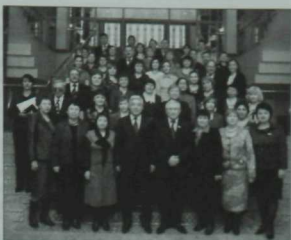
Республика китапханәчеләре Татарстан Дәүләт Советында Ф.Х.Мөхәммәтшин белән очрашуда. 2011 ел.

Сүз дә юк, китапханәдәге бүлекләренен безгә иң якиннары — беренчесе татар әдәбияты һәм туган якны өйрәнү бүлегә булса, икенчесе — кузьязмалар һәм сирәк китаплар бүлегә. Бүлек 1992 елда китапханә директоры Р.Вәлиев, галимнәр М.Госманов,