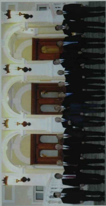
БДБ ыялыре жэтымэчелэрекең Казанда уткэе сэммиты, 2005 эл.