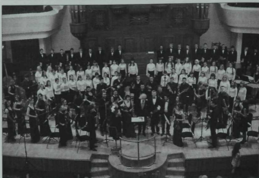
Нәҗип Жиһанов исемендәге Казан дәүләт консерваториясенең студентлар хоры һәм оркестры.