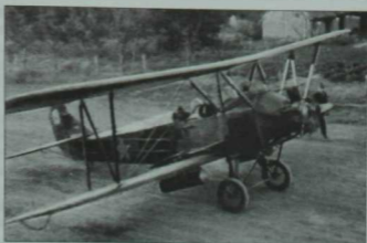
Казанда жыелган У-2 самолёты.