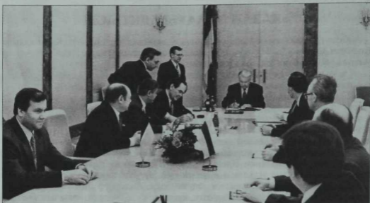
Россия һәм Татарстан арасында төзелгән тарихи Шартнамәне имзалау мизгелләре. Сул якта — Татарстан Республикасы элитәкчеләре. Уңда — Россия Федерациясе вәкилләре. Уртада — Россия Президенты Б.Н.Ельцин Шартнамәгә кул куя. 1994 ел.