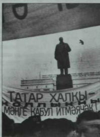
Онытылмас 90нчы еллар шигаре.