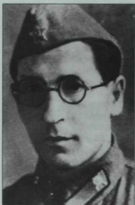
Нур Баян (Баянов Нур Галим улы, 1905-1945). Шагыйрь, мөхәррир, офицер. Бөек Жинүгә 15 көн генә калгач, Австрияне азат иткәндә һәләк була.