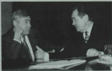
Кичәшле эш таркалмас. Минтимер Шәймиев һәм Фәрит Мөхәммәтшин. 1995 ел.