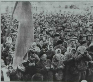
Урам-мәйданнарда халык ташкыны.