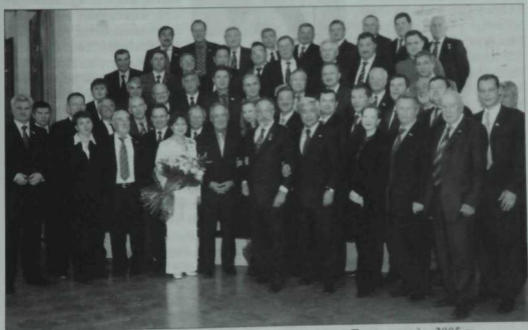
Россия Федерациясе Дәүләт Думасы депутатылары Татарстанда. 2005 ел.