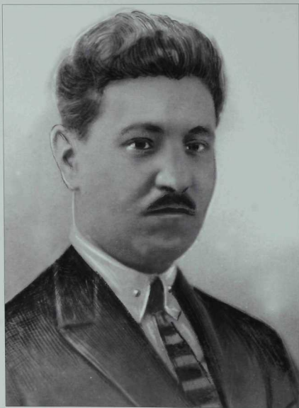
Мәхмүт Галәү (1886—1938)