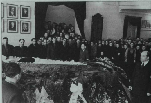
Драматург Тажжи Гыйззәтне (1895-1955) Татар академия театрынан соңгы юлга озату күренеше.