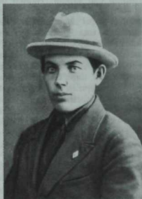
Демьян Фәтхи (Фәтхетдинов Касыйм Фәтхетдин улы) – шагыйрь (1906-43).