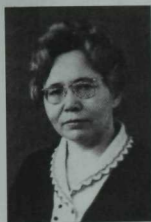
Шагыйрә Флера Гыйззәтуллина (1931).