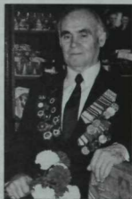
Сугыш ветераны, шагыйрь- сатирик Маннур Саттаров (1920).