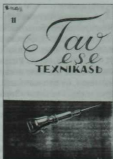
«Тау эше техникасы».

Мәскәү шәһәрində татар телендә чыгып килгән һәм 1930 елларда туктатылган 9 газета һәм журнал, үзләренен полиграфик эшләнеше, төрле төстәге бизәкле тышлыклар, иллюстрацияләр, күпсанлы фоторәсемнәр һәм пөхтә кагаз, шрифты һ. б. кебек сыйфатлары белән унай якка аерылып торалар. Әлеге басмалар совет иленең күп төбәкләрендә киң таратылган. Аларны яздырып алдыручылар, Татарстан һәм Башкортстаннан тыш, Идел буе, Урал, Себер, Казакъстан, Кыргызстан, Үзбәкстан, Әзербайжан, Украина, Белоруссия, Ерак Көнчыгыш, Мәскәү, Ленинград һәм башка урыннарда булган. Үзәк газета-журналларның мәжбүри рәвештә чыгудан туктатылуы татар матбугаты укучыларын Мәскәүдә нәшер ителгән ана телендәге бай эчтәлекле