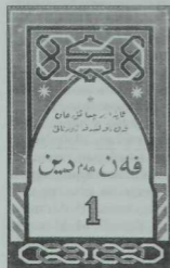
«Фән һәм дин».