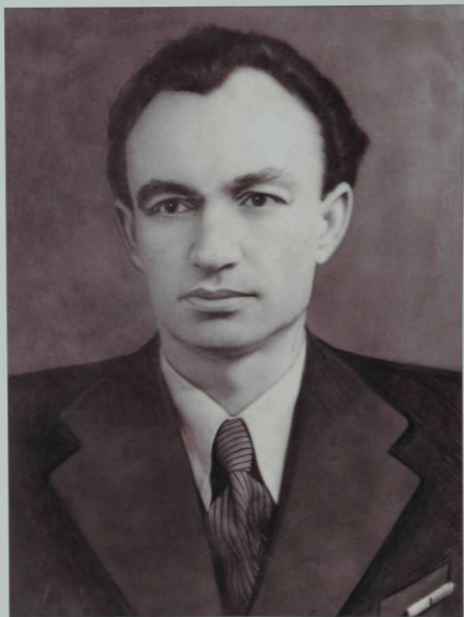
Нəжип Жиһанов (1911—1988)