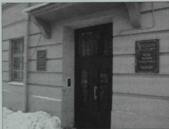
Бинаның тышкы күренеше

Салон түрөндә саргылт төстәге пианино. Шагыйрьнен үзенеке түгел түгелен, ләкин Жәлилнен пианино сатып алу турында хыялланыуы мәгълүм факт. Килгән кунаклар белән эдәби-музыкаль очрашулар, гадәттә, шушы бүлмәдә уза.