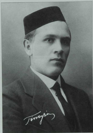
Кәрим Тинчурин (1887–1938)