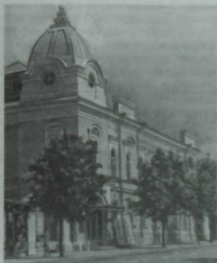
К. Тинчурин исемдәгә Татар дәүләт драма һәм комедия театры бинасы.