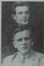
Салих Сәйдәшев һәм Кәрим Тинчурин, 30 нчы еллар.