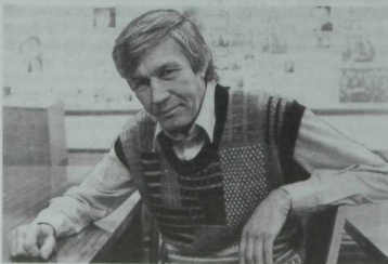
Шагыйрь Эдуард Мостафин (1945—1997).