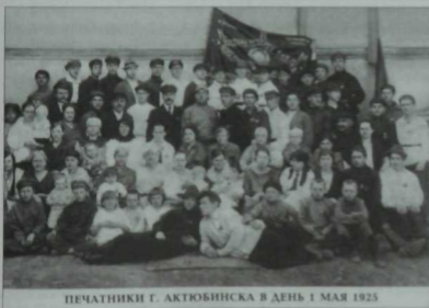
ПЕЧАТНИКИ Г. АКТЮБИНСКА В ДЕНЬ 1 МАЯ 1925

Актүбә каласында татарлар бүген дә гөрләтеп яшиләр: милли якшәмбе мәктәпләре