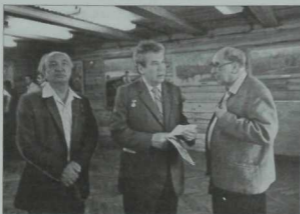
Композитор Нәҗип Җиһанов, Мостай Кәрим, Әмирхан Еңики Г. Тукайның Кыргайдагы музееңда. 1986 нчы ел.