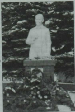
Шәйхи Мавтурын Мамадыш шәһәрндә куелган һәйкәле.