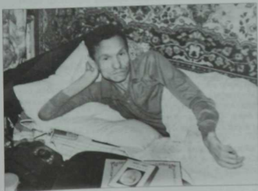
Татарстанның халык шагъйире Фәнис Юрүлин. 1998 нче ел.