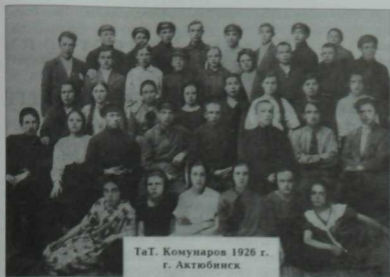
ТаТ. Комунаров 1926 г. г. Актюбинск