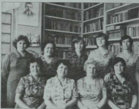
Татарстан Язучылар берлеге һәм язучыларның Әдәби фонд хезмәткәрләренән бер төркем. 70 нче еллар ахыры.