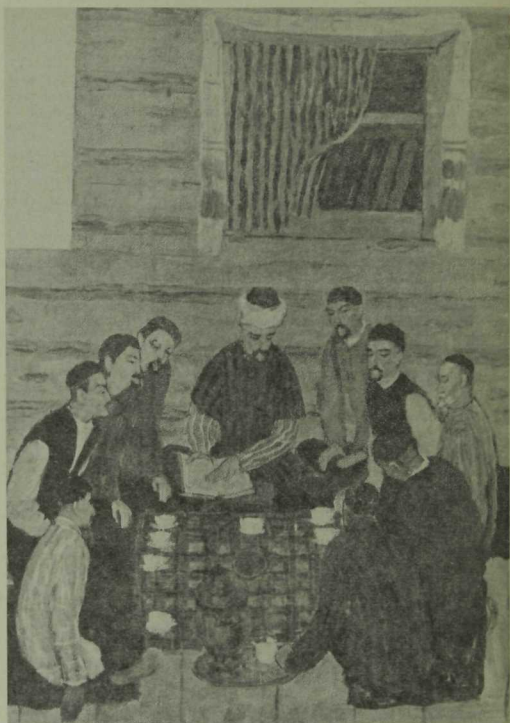
Kuman suze. (1992 ел)

Бу алым белән эш иткәндә Хәнафи бөек француз рәссамы Генри Матисс юлына баса—игътибар үзәгенә төсләрнең үзара багланышын, аларның бере белән бере чарпалашуын куй. Ләкин янача яза башлау рәссамга авыр бирелә, эзләнүләре озакка сузыла. Әйтик, Матиссның шактый әсәре («Гарәп кафеханәсе», «Әнгәмә», «Музыка дәресе», «Био» һ.б.) гомумән, шартлы рәвештә, контурлар белән генә бирелгән. Шуларга карап, тамашачы персонажларны төгәсн күзалдый. Даһи рәссам примитивизмга ук барып житми житүен, аның рәсем ясап чыныккан кулы форманы әнә шул контурларга карап та шәйләрлек итеп бирә, тик инде кешенең авыз-борынын, кашын-күзен мөмкин кадәр төгәлрәк тасвирлауны үзенә максат итеп куймый, төсләрнең бирелешен генә алга сөрә.