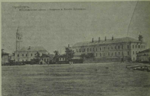
«Хосәения» мәдрәсәсе һәм мәчете.