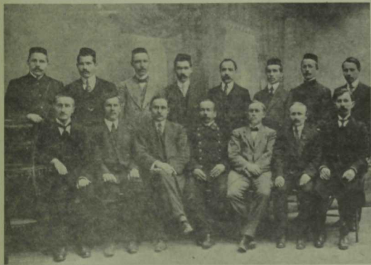
«Хосеения» мәдрәсәсенең бер төркем мөгаллимләре. 1915 ел.

Мәдрәсәдә шәкертләр саны биш йөздән артмаска тиеш булса да, кайбер елларда анда укучылар күбәеп киткән. Мөгаллим-хәлфәләр саны утыз-утыз бишкә житкән. Аларның хезмәт хакы бүтөн мәдрәсәләрдәгедән шактый артыграк, шунлыктан иң төжрибәле һәм белемле укытучыларны сайлап алу мөмкинлеге булган. «Хосеения»нең педагоглары арасында төрле-төрле губерналардан