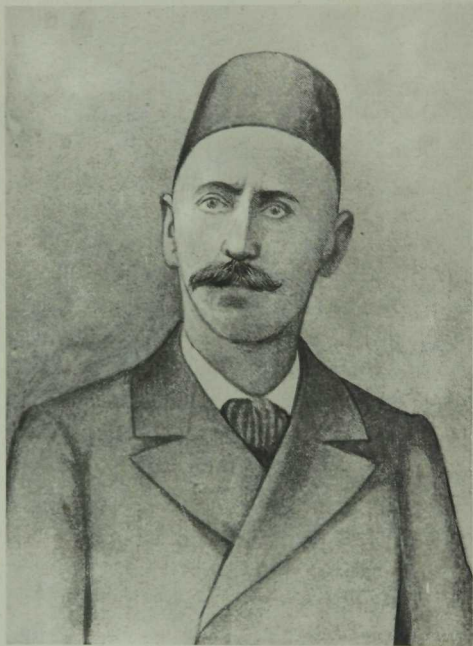
Исмәгыйль бәк Гаспринский (Гаспралы) (1830—1914)