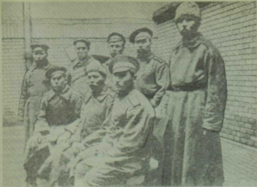
Татар әсирләренән бер төркөм.

арасында иң кыйммәтлесе — Казан татарлары фольклоры. Аларның теле исә әдәби тел дәрәжәсенә күтөрөлгән.