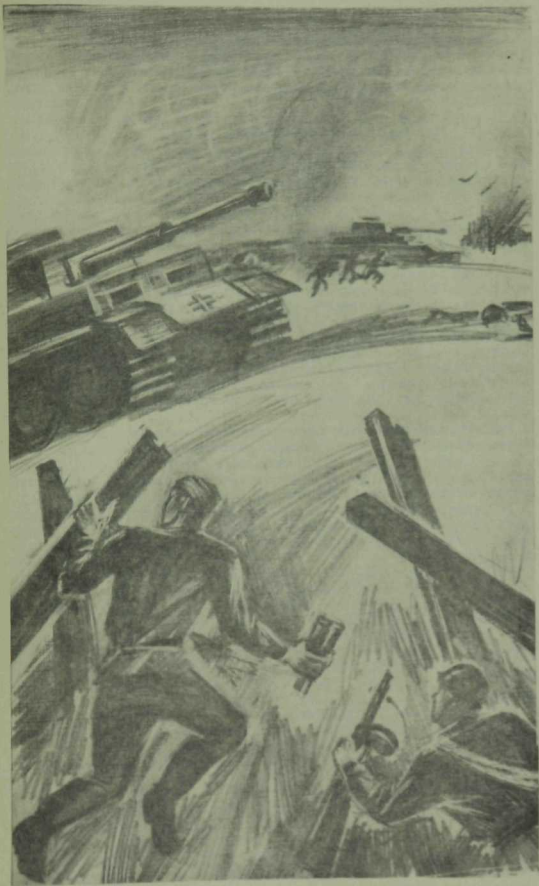
А. Тимергалина рисунок.