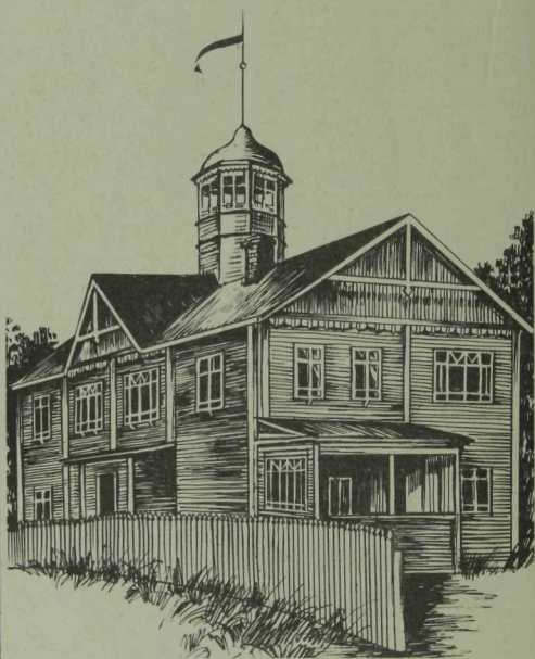
Б. Мәксүтовның кымыз дачасы