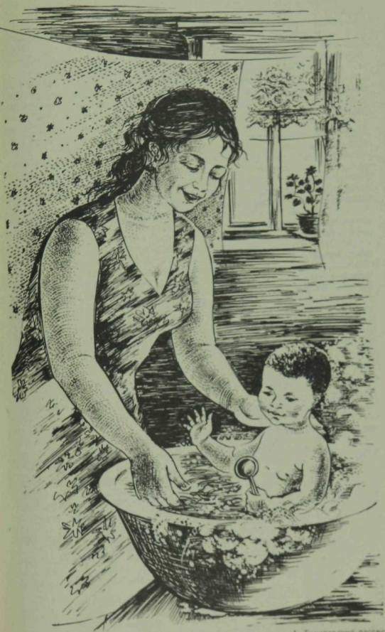
А. Тимирязина расаже