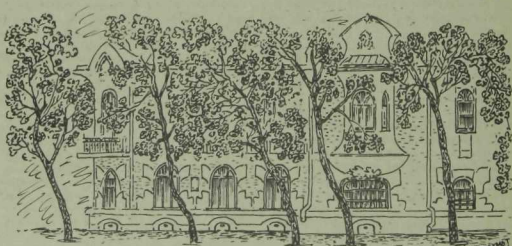
Казанда Г. Ибраһимов яшәгән йорт (Комлев урамы, 33)