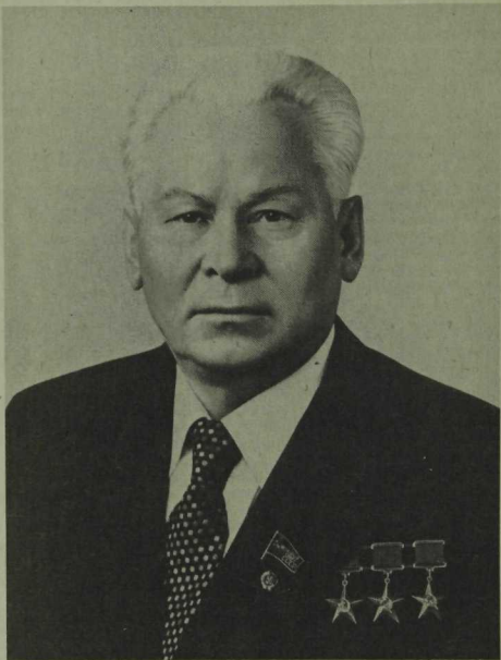
КОНСТАНТИН УСТИНОВИЧ ЧЕРНЕНКО