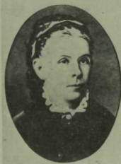
Мария Александровна Ульянова (1835—1916)