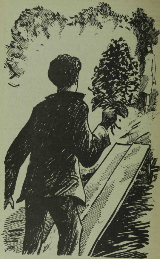
Тавил Хаџиэхматов рәсеме