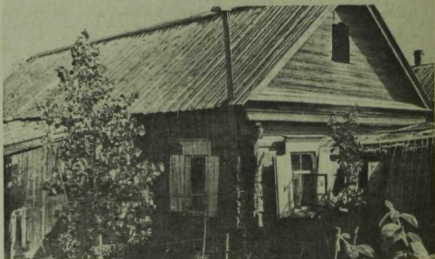
Рәсемдә: Әстерхан өлкәсендәге Киләнче авылында Ибраһим Мәхмүтов йорты. Биредә 1933 елда Муса Жәлил тукталган.

Икенче көнне иртә белән торып ашагач-эчкәч, күк юргага рессур 1 арба жигеп, киттек бригадаларга, эшләгән жиргә. Муса аларның эшләре белән танышты, ашларын да татып карады. Ул вакытта без балык белән генә туена идек. Безнең бригадаларда ике казан иде: берсе — «ударниклар», икенчесе — «ялкаулар» казаны. Ударникларга ике тәлиңкә аш, кыздырылган балык биң идек, ә ялкауларга бер казан балык шулпасына бер стакан ярма салып пешерә идек. Казан янына язып куйган идек: «ударниклар казаны», «ялкаулар казаны». «Сиңа ялкаулар казаныннан», дип әйтсәң, ул кеше әлеге казан янына якын да бармый иде. Оят бит. Муса, бригадаларга килгәч, бу хәлне күрде. Соңыннан ул жыелыш жыйды. «Ялкын» газетасында аның бу турыда язган «Ике казан» исемле мәкаләсе басылып та чыкты.