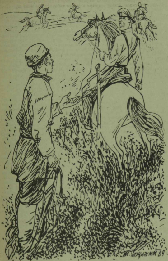
Т. Хажиахметов росеме.