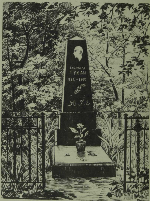
Казанның Татар зиратында Г. Тукай кабере. Татьяна Зуева рәсеме.