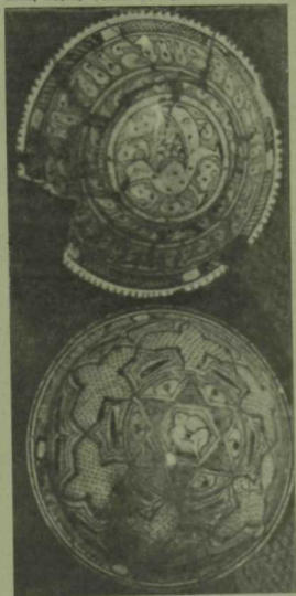
Болгар шәһәрлегендә табылган савыт-саба. XIII—XIV йөзләр.