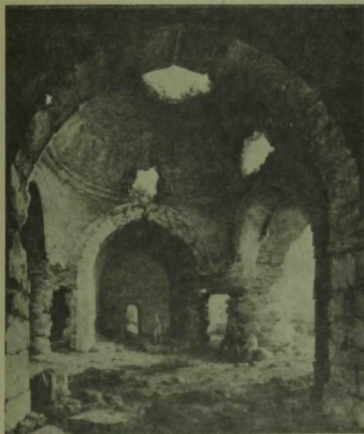
Риссам Н. Г. Чер- нецовның «Болгардагы мунча» картинасын- нан. 1839 ел. Хәзерге көндә Мәскәүдә Третьяков галерея- сында саклана.

XIV йөздә Болгар кабат бәй һәм матур шәһәргә әверелә. Шушы вакытта яшәгән бай сөүдәгерларнең, аксәякләрнең йорт нигезләрен казыган археологлар бик күп кыйммәтле әйберләр таптылар. Алар ара- сында Ираннан, Кытайдан, башка ерак ил- ләрдән китерелгән йорт кирәк-яраклары, бизану әйберләре дә очрый.