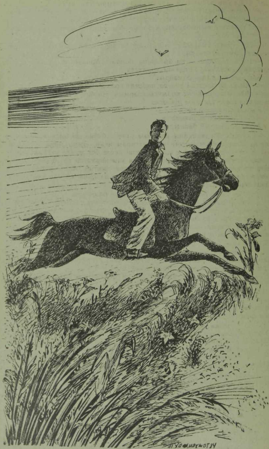
Г. Хажиевтын зураг.