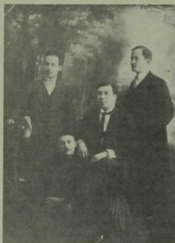
Рәсемдә (уңнан сулга): Камал I, Фәйзулла Тушев, артистлар Газиз Монасыйпов, Нуретдин Ахунов.

Габдулла Камал (сәхнәдә — Камал I) татар театрының бер вәкиле буларак, башка төрки халыкларның театрларын оештыру өчен күп көч куйды. Ул үзе иҗат иткән һәрбер образның эчке хасиятен, фигураларга тырышты, бер вакытта да отышлы образ белән мавыгып, спектакльнең ансамбленә хыянәт итмәде, киресенчә, аны булдырырга тырышты. Безнең театрыбызда үзен генә күрсәтергә тырышкан артистларыбыз да булмады түгел. Г. Кариев мәктәбен үткән артистлар бу «авыру» белән чирләмәделәр. З. Солтанов, Г. Мангушев, К. Тинчурин, Б. Болгарский, Г. Болгарская, Н. Таҗдарова, Н. Арапова, Ф. Ильская һәм бик күп башка артистлар сәхнәдә бербөтен ансамбльдән чыкмый яшәделәр. Бу сыйфатлар Камал I га дә хас иде.