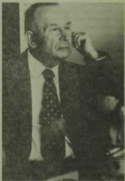
С. Хәким: «Шагыйрь күңелә жирдәге изгелекне жырларга тиеш»

Әсәрләребезнең Бөтенсоюз күләмендә яңгырамавына без үзәбез дә гаепле. Безгә артык тыйнаклык комачау итә. Фикердә тыйнаклык... Кайсыбер яңа әсәр чык-