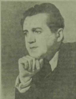
дигән уйдирмаларын юкка чыгарырга

Салих Сәйдәшев иҗаты татар сәнгате-нең социалистик реализм методы белән кораллануына зур өлеш кертә. Композиторның көн кадагына сугып, актуаль вакыйгалар уңаеннан язылган әсәрләре дә чор куйган идея-политик һәм эстетик таләпләргә туры килә, халыкның сәнгатькә омытылыш-ихтыяжына җавап бирә. Кызыл Армия төзелүнең 11 еллыгына багышланган атаклы марш, Кәрим Тинчуринның «Кандыр бие» пьесасына иҗат ителгән музыка нәкъ өнә шундыйлардан. Беренче тапкыр күтәрелгән темалары белән үк игътибарга лаеклы, яңа заман кешеләренең кабатланмас музыкаль образларын тудырган бу әсәрләр озын гомерле булды. С. Сәйдәшев иҗатының реалистик асылы һәм гуманистик юнәлеше, социалистик Ватаныбызның зур художникларына хас булганча, чынбарлыкны дөрес чагылдыру, кешеләргә сәнгатьнең илаһи көче белән тәрбияләү һәм берләштерү сыйфатларына ия булуында күренде. Җәмләдән шуны да әйтергә кирәк: татар композиторының һәр әсәре нигезендә яткан әлеге үзенчәлек үзе генә дә буржуаз идеологларның, янәсә, музыка сәнгате сыйныфлардан бәйсез яши, ул аерым идеяләргә гәүдәләндерә алмый, сәләтле.