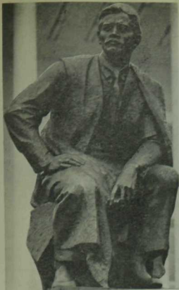
Шагыйрьнең Уфадагы һәйкәле.

карт хәзрәт, Галига сабак бирүче бозык күчелле хәлфәләр, кыргый инстинктлары уяган, шәригатькә суыкларча ышанган надан мужикләр, куштаннар.