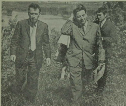
1969 ел. Гариф Ахунов һәм Италия язучысы Джанни Родари Ленино-Кокшетинода.

Сарымсаков исә вузда укыту кебек изге эшне материал төзмин ителү чыганагы итеп кенә исәпли, үз эше белән мавыкмый, чөнки ул аны яратмый. Студентларга да өстән торып кына карый. Әхлак ягыннан да шактый түбән төгәрәгән бу кеше фәндә урау юллар белән карьерага омытыла, ләкин фаш ителә. Нәтижәдә Сарымсаков университеттан куыла. Намусы чиста булмаган кешегә партия яшьләрне укыту эшен ышанып тапшыра алмый.