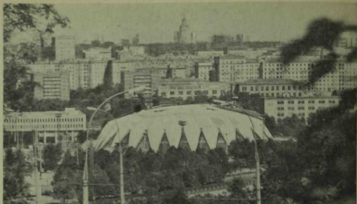
Универсаль спорт залының тышкы күренеше.

кадер энергия сарыф итә. Аны тулыландыру өчен Олимпия авылы ашханәләрендә һәр аш-сунның күпме калорий энергия бирүен күрсәткән махсус язмалар эләнган. Бу бигрәк тә боксчылар, штангачылар һәм көрәшчеләр өчен кирәк. Чөнки аларга беренче көнгә авырлыкларын арттырырга да, киметергә дә ярамый: үлчәүләре үзгәрсә, икенче категория атлетлары сафына күчәрәләр. Спортчы үз авырлыгын хәтта 100 граммга гына арттырган очракта да медальдән колак кагуы мөмкин.