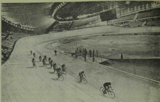
Крылатское велотрегында ярышлар бара.

Зәңгәр божра — Европа, сарысы — Азия, карасы — Африка, яшеле — Австралия, кызылы — Америка символы. Беренче Олимпиададан соң аның флагы икешәр тапкыр Париж һәм Лондон, берәр мәртәбә Сент-Луис, Антверпен, Стокгольм, Амстердам, Лос-Анджелос, Берлин, Хельсинки, Мельбурн, Рим, Токио, Мехико, Мюнхен, Монреаль шәһәрләре күгәндә жилфердәдә. Жәйге Олимпиаданың алтынчысы — Беренче, XII һәм XIII Уеннар Икенче бөтендәния сугышы нәтижәсендә үткөрөлми калды.