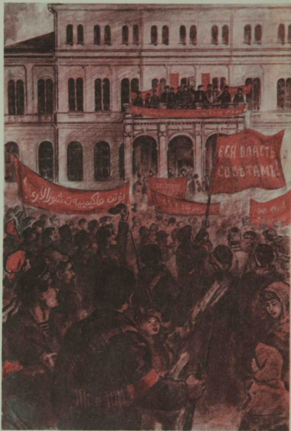
КАЗАНДА СОВЕТ ВЛАСТЕН ИГЪЛАН ИТУ.