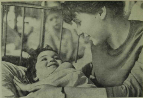
«Июкла, кызым, Күз нурым!»

бияләне ул өйгә алып кереп жылытты, киптерде дә Фирүзәләр йорты каршындагы өрәңгә ботагына чыгарып элде.