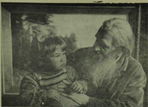
Татарстанның халык художнигы К. Е. Максимов — балаларның якин дусты.