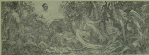
Тукай үзенең экият геройлары арасында. Киндер. Темпера.

рәтләнган агачлар. Барысы да кызыксынып карала, чагыштырмача тыйнак нисбәттә һәм арттарак торуга карамастан, Шүрәленең үзәк фигура булуы аермачык. Ирекседән, әгәр Ф. Әминев язучы булса, мавыктыргыч сюжет остасы икәнлеген тагын да бер кат раслар иде, дип уйлыйсың.