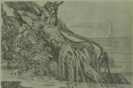
Айлы кич («Шүрәлә»). Киндер. Темпера.