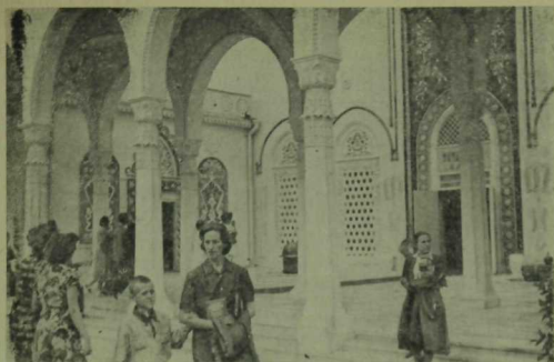
Бөтенсоюз авыл хужалыгы күргәзмәсендәге Татарстан павильоны. 1940 елгы фоторәсем.