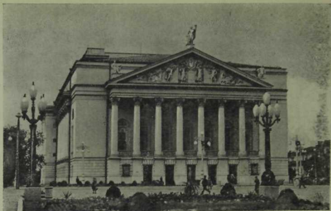
Муса Жәлил исемендәге татар дәүләт опера һәм балет театры.

Бу төбәктә яңа корылышлар булыр өле. Эшне давам иттерәчәк төземчеләр Исмагыйль ага 1 салган идеягә төшенеп, ул төбәкнең архитектура бердәмлеген сакларлар дип ышанасы килә.