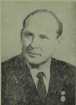
СССРның халык артисты Шәүкәт Биктимеров.

чын мәгънәсендә кеше итә торган рухи сыйфатлар ничек туа? Нинди ул — кеше? Актер әнә шундый сорауларга җавап эзли.