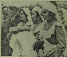
Кырлай кызлары кунаклар каршылыы.

Шагыйрьнең 90 еллык юбилее көннәре Тукай-Кырлай авылында аеруча зур тантана төсен алды. Монда Г. Тукайга багышланган өр-яңа мемориаль комплекс: шагыйргә яңа һәйкәл, ике катлы музей бинасы, китапханә һәм кунак өе, «Шүрәле» дип аталган истәлек паркы салынган. Зур