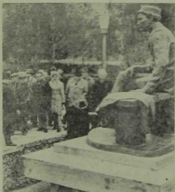
Г. Тукайның Кырлайдагы һәйкәле.

Г. Тукай юбилее уңае белән Татарстан сынды сәнгать музеенда күргәзмә ачылды. Анда Г. Арсланов, Б. Урманче, Л. Фәттахов, Б. Әлменов, Ф. Әминов, В. Кудель-