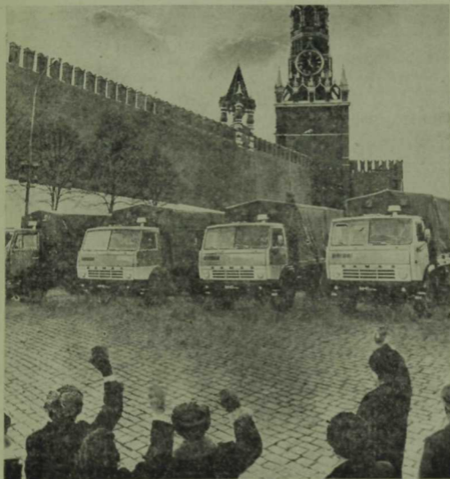
КамАЗ машиналары Кызыл майданда

Менә комплекс корпуслары панорамасы. Аларда көйләү-жибөрү эшләре бөтен көчкә бара. Ә КамАЗ корпуслары белән янәшә төзелеш индустриясе завод-