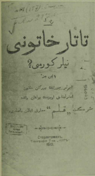
Г. Ибраһимовның «Татар хатыны ниләр күрми» китабының тышлығы.

Эстәрлитамак өязендәгеси тикшерелгәннән соң кулыңыздагыи мона шул сәхифәләр караланды.