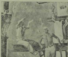
Кама акчарлаклары. В. Скобеев.

беренче сурәт буларак өсләренә сорма, халат, аякларына күн итекләр кигән кызлар күзгә ташлана... Э күзләрендә аларның берьюлы арганлык та, житдилек билгеләре дә чагыла... Тагын шундый контраст: читтәрәк электросварка утлары ялтырый, ә бер кызың кара бияләенә кунган ак күбәлек күренә...» Бу күргәзмәнен танылган рәссам Харис Якуповның «Чаллы гүзәлләре» дигән шушы картинасын караудан башлануында зур мәгънә бар: димәк, заман темасын, күтәркенә хезмәт пафосын, тормыш гүзәллеген, кешеләр мөнәсәбәте матурлыгын якты буяулар белән оста сурәтләнеләргә кирәк. Өч меңнән артык рәсем, графика, плакат, скульптура, монументаль-декоратив һәм сәхнә әсәрләрен декорацияләгән хезмәтләр арасында шулай күренә белү ил тамашачыларының тирән хөрмәтенә лаек! Күргәзмәдә шулай ук хезмәт коллективлары, яна төзелешләр, хәзерге колхоз һәм совхоз