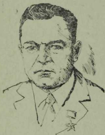
Нефть җайланмалары начальнигы, Социалистик Хезмәт Герое Мәсьгут Миннекаев.