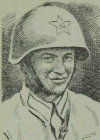
Советлар Союзы Герое Я. Кольчак

...Олы юлга чыкканда кемдер генералга дивизия художнигының Кольчак белән «месер» дуэлен рәсемгә төшереп алганын әйткән. Усмановны дивизия командиры янына чакырдылар. Генерал альбомнан озак күзен алмый торды.