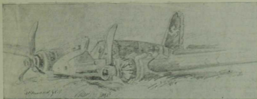
Бәрәп төшөрөлгән фашист самолеты