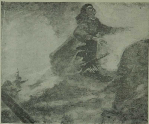
Советлар Союзы Герое Газинур Гафиятуллинның батырлығы