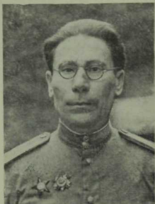
Беренче Украина фронтында миномет батареясе командиры, хәрби частының партия оешмасы җитәкчесе, «Ватан намусы өчен» исемле фронт газетасы хезмәткәре. Хәрби чины — старшина.