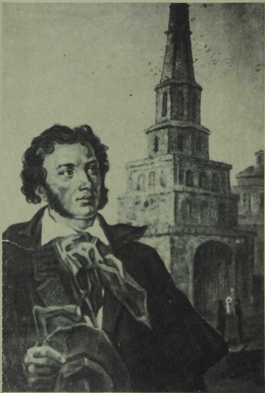
ПУШКИН КАЗАН КРЕМЛЕНДӘ.