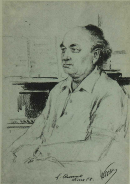
Композитор НӘЖИП ЖИҢАНОВ Ф. ӘМИНЕВ рәсеме