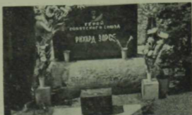
Токио шәһәре янында Рихард Зорге кабере.

Бөек Ватан сугышы миллионнарча яшьләргә яңадан-яңа җиңүләргә рухландыра алырлык бик күп батырлар бирде. Шулар арасынан берничә кеше: рус кешесе Кузнецов, татар Муса Җәлил һәм немец Рихард Зорге мине аеруча сокландыра. Без аларның исемнәрен һәр вакыт горуранып искә алабыз. Дошманның үз оясында эшләделәр бит алар. Ай түгел, ел түгел, берничә еллар! Кем икәнлекләрен дошманга түгел, дусларга да әйтергә ярамады.