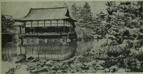
Киото шәһәрендә Милли парк.

тудыру өчен кондиционерлар куелган, иң бай йортларда исә бассейнар, бакчалар ясалган. Мондый йортларның бизелеше, уңайлылыгы иң таләпчән кешеләрне дә канәгатьләндерерлек. Ләкин мондый йортлар бик аз. Япон халкының сиксән проценты җил очырып китәрдей йөзләрчә, миллионнарча бәләкәй агач йортларда яши. Дөньяда иң зур кораблар һәм иң кечкенә, 25 грамм авырлыгындагы телевизорлар, соклангыч транзисторлар һәм фотоаппаратлар эшли ала торган сәләтле һәм тырыш халыкның шундый начар йортларда яшәве безне гажәпкә калдырды. Бу агач йортларның бер тәрәзә-ишекләре дә юк. Җиңел түшәм һәм ширманы хәтерләткән стеналар. Ширма дим, чөнки стена дигәнәбез агач рәшәткәдән һәм шул рәшәткәләргә тарттырылган дөгә кәгазеннән генә гыйбарәт. Хужа шушы рамны шудырып ача да тәрәзә була, икенче бер рамны шудырып җибөрүенә ишек була. Мондый өй хужаның бакчасында, я су буенда, урманда торса һәм ул өйдә кешеләр җәй көннәрендә генә яшәсәләр, бәлки исең дә китмәс иде. Ләкин курчак өен хәтерләткән мондый өйләрнең японнарның бердәнбер торагы булып, бу торакның шау-шулы шәһәр урамында булуы безне тәмам аптырашта калдырды. Шунуң өстенә,