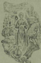
ДОСТУК ГҮЛ ДЕСТЕСИ