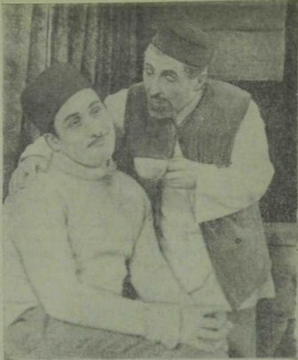
«Акчарлаклар»да — Шәрәфи карт.

тиеш диг карый һәм Ленинга да: «Сез дәүләт белән һәр кухарка идәрә итәргә тиеш»,— дигән идегез. Әлегә никтер алар күренмиләр?»— диг сорау бирә. Ленин аның эшләре белән танышкан, мастеры «кәрт тиле» диг атаган кешеләрнең гаҗә-бәнә каршы: «Нинди баһадир кеше ул сезнең мастерыгыз! Без утырышларыбызны аның төсле итеп оештыра белсәк иде. Мин аның эшен караган чақта мәнә нәрсә турында уйладым!»— диг баяли. Әнвәр Ленин образын иҗат итүче олы талант исә Шәүкәт Биктимеров белән бу спектакльдә яңадан очраша. Шәүкәт Ленин ролен шундый бер нечкәлек белән эченә кереп уйный ки, Әнвәр үзен Шәүкәт Биктимеров белән түгел, Ленинның үзе белән очрашкан кебек хис итә һәм чын Сухожилонка өверелә.