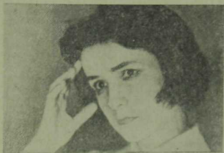
«Зәбәйдә — адәм бәласы» спектаклендә Зәбәйдә.