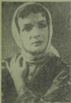
«Гүзәлем әсәл»дә Әсәл.