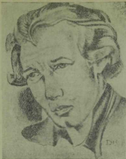
Дмитрий Красильников. Хәсән Туфан портреты. «Безнең юл» журналынан алынды (1927 ел, 6—7 нче саннар).

Арсланов тарафыннан иллюстрацияләнгән. Ул эшләгән рәсемнәри «Кызыл яшләр», «Октябрь яшләр», «Чаян», «Авыл яшләр» һәм башка журналларда шулай ук бик еш очратырга мөмкин. Әлбәттә, ул рәсемнәр күрә уңышсыз чыкканнары да бар. Ләкин хәйран әйбәт ясалганнары да байтак. Госман Арслановның ул еллардагы график эшләренәң иң уңышлыларыннан берсе, минемчә, «Безнең матбугат» исемле китапка эшләнгән тышлык [Казан. 1924 ел]. Бу тышлык ике төрле төс белән эшләнгән. Аның вертикаль сызыклары — кызыл. Тышлыкның югары өлешенә өч ак медальон ясалып, шуларга караткәстәге стильләштерелгән гарәп хәрефләре белән китапның исеме язылган. Графика белгечләре бу хезмәтне уңышлы дип тапканнар һәм ул үз заманында Парижда үткөрелгән күргәзмәгә дә куелган булган.