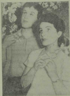
«Беренче мәхәббәт» спектакленнан бер күренеш.