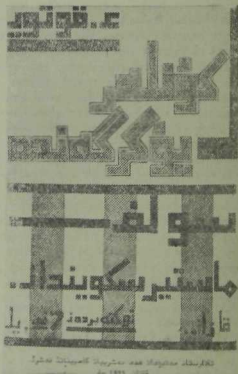
Фәик Таһиров. Гәдел Кутуйның «Көннәр йөгәргөндә» исемле жыентыгының тышлығы. Казан. 1925 ел.

Сынлы сәнгать өлкәсендә дә андый халык талантлары булган, әлбәттә. Матурлыкны тою хисе безнең халыкта бик көчле бит. Ләкин аларның исемнәре тарихка теркәлеп бармаган, кызганычка каршы, онытылган. Шуңа күрә без аларның үзләре һәм ижаатлары хакында иркенләп сөйли алмыйбыз. Шуңа күрә бу мәкаләдә без сүзгә исемнәре һәм хезмәтләре билгеле булып та, соңгы елларда хаксызга онытыла башлаган профессиональ рәссамнарыбыз хакында гына алып барырга үйладык.