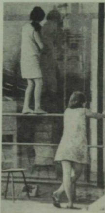
Кызлар хыялыдай яктырды тәрәзәләр.