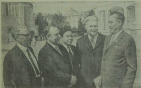
СССР язучыларының V съезды. Татар әдипләре немец язучылары белән. («Neues Leben» газетасында басылды.)

СССР Верховный Советы Президиумы Указы белән совет культурасын, әдәбиятын һәм сәнгать үстерүдә ирешкән унышлары,