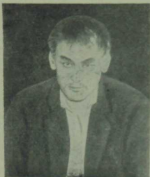
«Гүзәлем Әсәл»дә Байтимер.