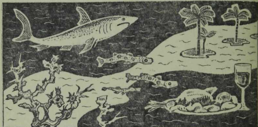
Сине кайнар нурлар иркәли, Көннәр сина чәчәкләр суза. Синең гүзәл ярларың буйлап Төз пальмалар йөгереп уза.

Без Гинд океанын көнбатыштан көнчыгышка таба кисеп чыктык та хәзер Индонезия ярларына якынлашып киләбез.