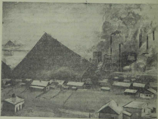
Ильич исемендәге шахта.

ратив һәм сынлы сәнгатебез бөтен яктан артта калганга, Урманче барысына да жиктешкән һәм шушы сәнгатьтә кайсы тармагына ихтыяжыбыз зур булса, шул юнәлештә күбрәк иңат иткән. Ул 1919 елда ук сынлы сәнгатьнең өч төп тармагында эшли башлый (скульптура, нәгыш, графика) һәм бөтен гомере бую шушы өлкәләрдә эшләвен давам иттерә. Боларга янә театр декорацияләре өстәлә. Әле 1928 елларда мәрхүм Карим Тинчурин белән бер спектакльне декорацияләргә әзерләпел эскизлар ясып. [Ләкин болар әшкәртелми калалар.] Ул ук — безнең әллә кайчан ук ваттырылып кырылган Болгар, Казан сарайлары диварларындагыча элпәле таш бизәкле майолик сәнгатьне тергезүче дә. Ләкин ул бу тарманлар белән генә калмый, аның талмас көчле кулы агач, ташларны да сәнгать әсәрләре итеп уймалый. Үзенең иңат көчен