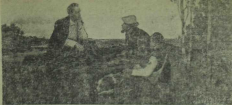
Г. Милентьевның «Володя Кокушкинода» рәсемнән репродукция.

1888 елның язы иртә килде, кар да тиз эреп бетте. Менә инде урамыңарга, чокыр читләренә чирәмнәр чыкты, кырлар, урманнар да яшеллеккә төрөндө.