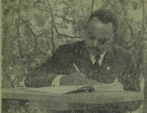
Эфиопиянең депутатлар палатасы председатели Фитаурази Бенса Джалло «Кунаклар китабы»на яза.