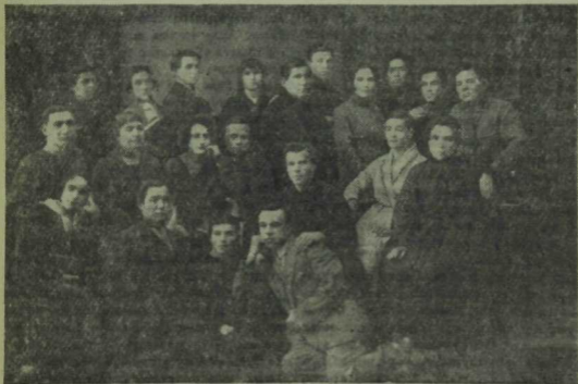
Татар-башкорт труппасы, 1925—1926 ел. Уфа.

Көннәрнең берендә Башкортстан сәнгать эшчеләре союзының 5 нче съезды уздырылды. Мортазин белән мине делегат итеп жиберделәр. Минне идарә составына да сай-